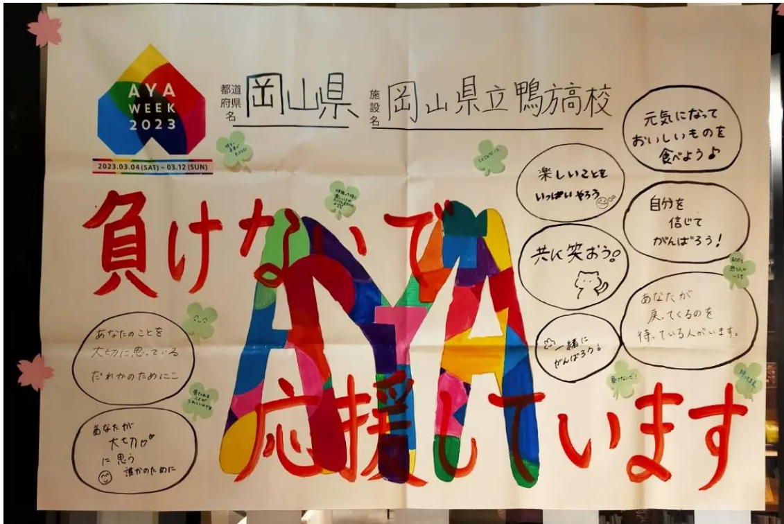
岡山県立鴨方高等学校