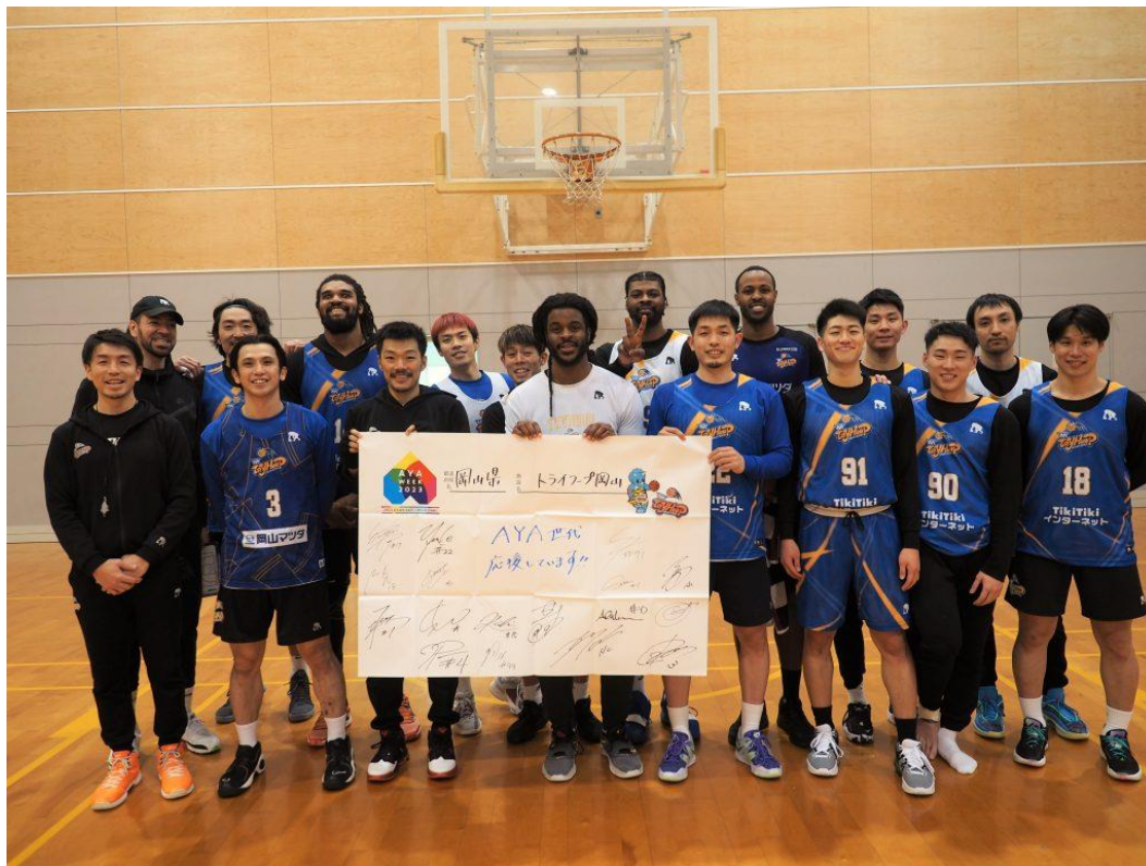
プロバスケットボールチームトライフープ岡山