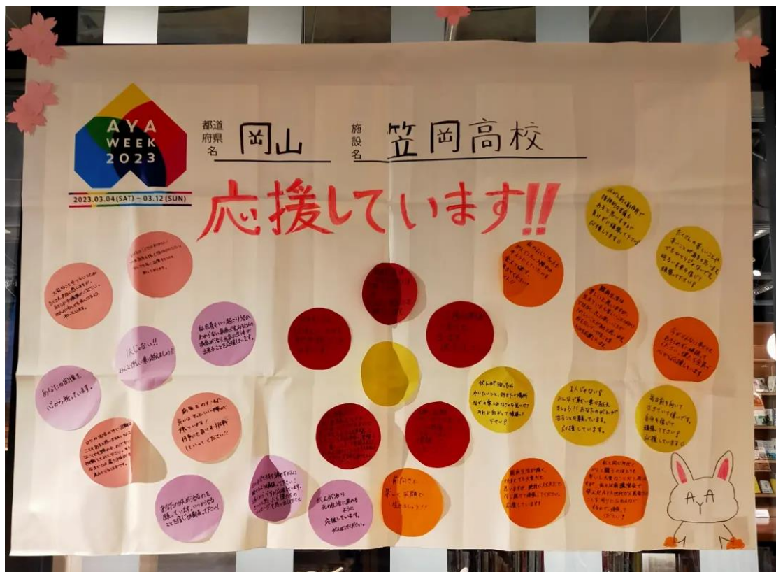
岡山県立笠岡高等学校