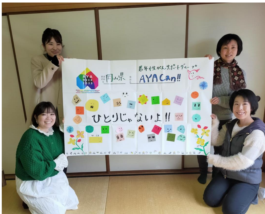
若年性がんサポートグループAYACan!!